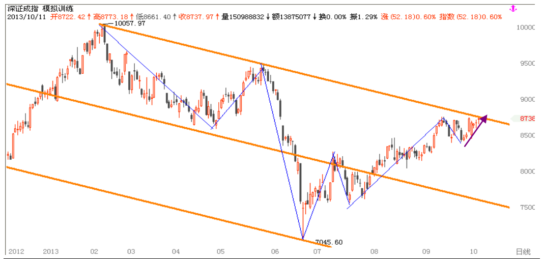
图1-3:深圳成指日线行情级别分段:受通道阻力压制