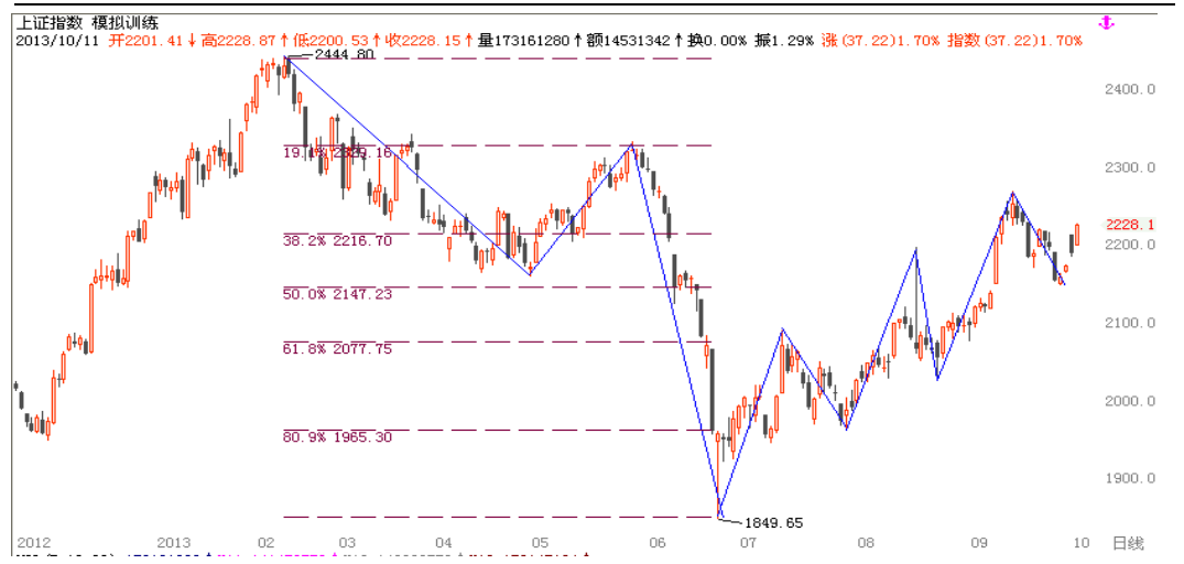
图1-1：反弹面临下跌比例的61.8%回撤阻力