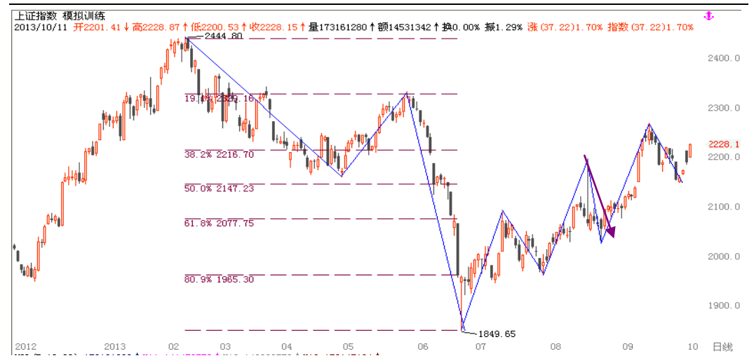
图1-2：上证指数日线图：目前位于下跌波段转上涨波段的临界点

为使得研究的结果更有现实意义，我们界定政策转向的时间点为2010年10月，采用日线级别点位重新划分紧缩政策实施以来的市场形态与时间区间。（更详细解释请参考《考虑市场情绪后的高Alpha股票选取——股指周报附件》）