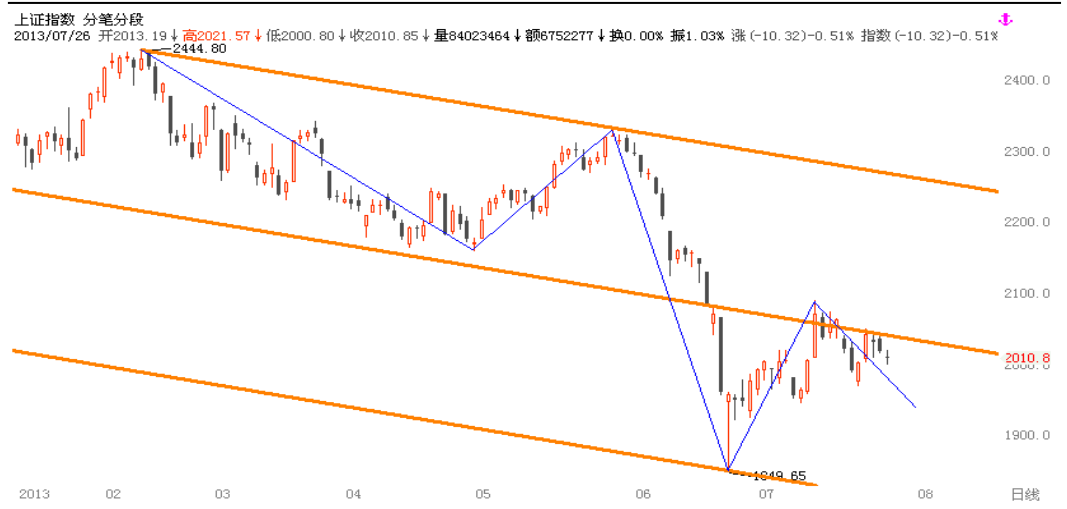
图1-2:上证指数日线行情级别分段:处于下跌波段

为使得研究的结果更有现实意义,我们界定政策转向的时间点为2010年10月,采用日线级别点位重新划分紧缩政策实施以来的市场形态与时间区间。(更详细解释请参考《考虑市场情绪后的高Alpha股票选取——股指周报附件》)