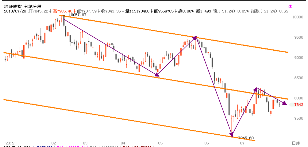
图1-3:深圳成指日线行情级别分段:深市走势及分段与上证一致