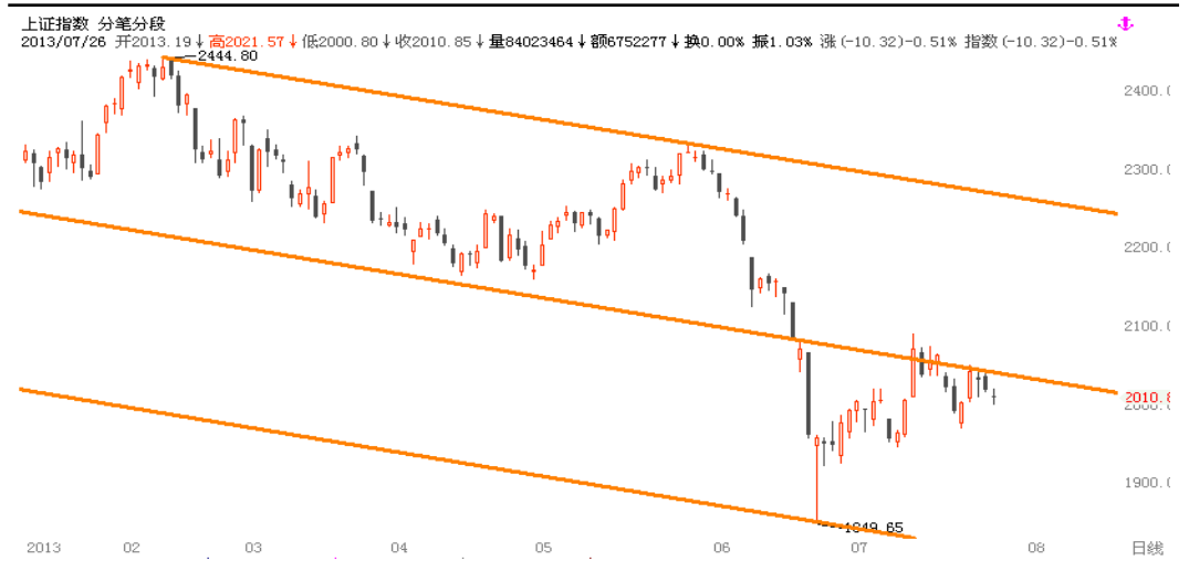
图1-1: 上证日K线图：中轨压力制约7月反弹

综合来看，目前内外难寻利好消息，且地方债务平台的风险开始初步暴露、而创业板指数已出现资金撤离的警示性信号，这对本周的市场情绪都有影响。对主板而言，在经济探底过程中，加上经济转型的考虑，周期性的板块及公司很难出现盈利拐点，大盘蓝筹股难形成上涨动力。技术形态上，目前上证的短期均线组合均被下破，日M ACD也即将进于死叉临界，目前的盘整格局不排除在本周演变成空头格局的可能。操作上，空头可尝试性轻仓介入，空头止损设于上证2025，IF主力2230。