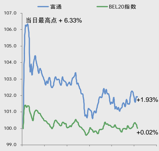
富通当天股价表现 (以100为基点)