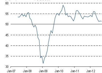
欧元区 PMI 创新低