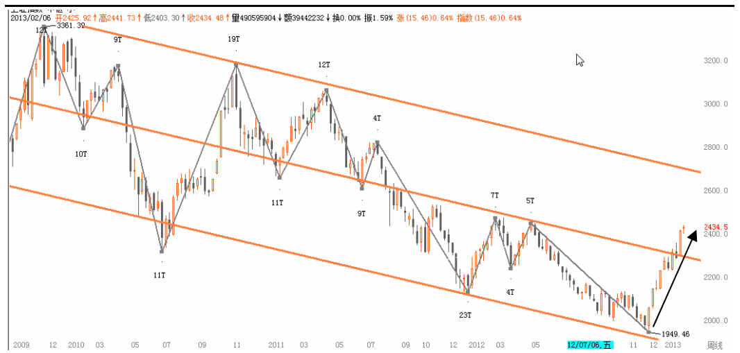
图2-1: 上证周K线图：2300一线的下行通道中轨逐渐企稳