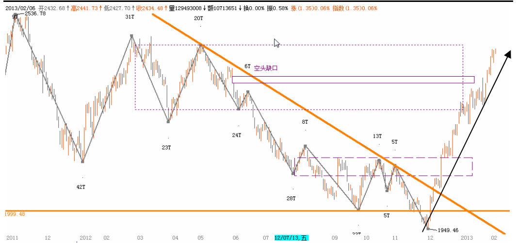
图2-2: 上证日K线图：上方将面临2480颈线位