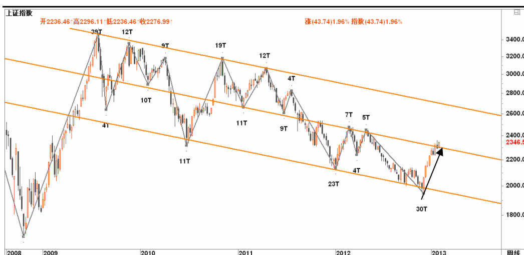
图2-1: 上证周K线图：2300一线的下行通道中轨到达，进入关键争夺区