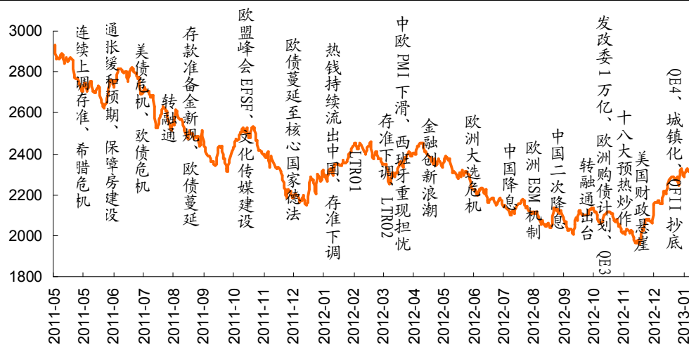
图1-1: 上证指数动力-形态全景图

市场方面，资金供给方面公开市场连续正回笼资金，而资金需求面上，本周解禁规模继续保持在高位。从解禁个股来看，沪深两市权重股成为解禁主力，中小板解禁压力亦不容小觑。数据统计显示，本周 (1 月 28 日至 2 月 1 日) 共计有 44.45 亿股解禁，涉及 15 只个股，较之上周 37.81 亿股的解禁数量小幅增加 17.56%，不过解禁市值并未同步扩大。