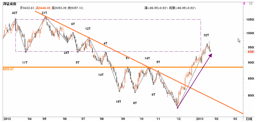
图1-4:深圳成指日线行情级别分段: 下跌波段或从24日开始, 但仍待几日观察以确认