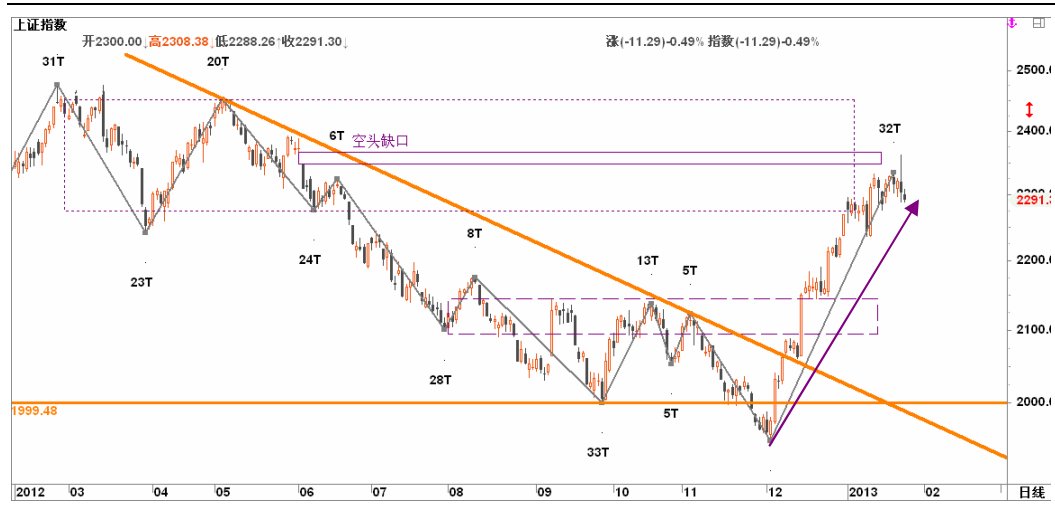
图1-3:上证指数日线行情级别分段:下跌波段或从24日开始,但仍待几日观察以确认