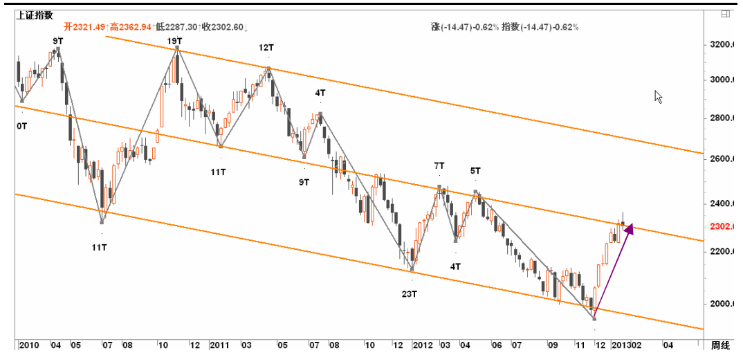
图1-2: 上证周K线图：遭遇下降通道中轨一线压力