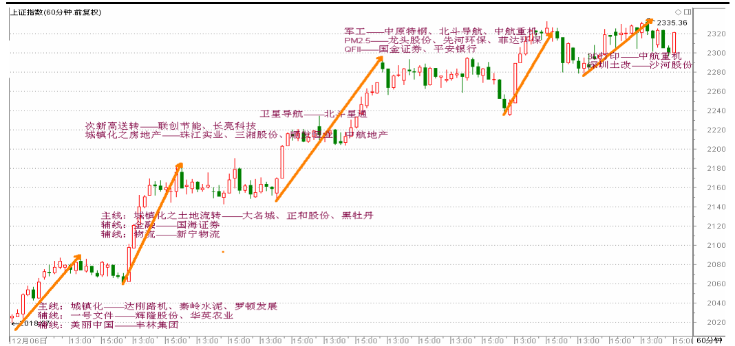
图2-2: 上证60分K线图：小级别上涨动能相比此前已大有萎缩