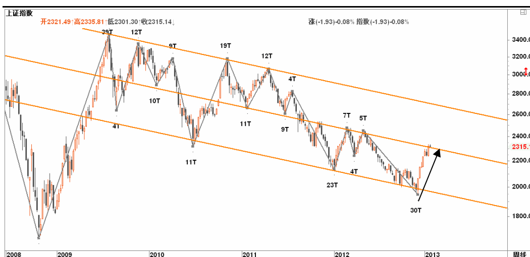
图2-1: 上证周K线图：2300一线的下行通道中轨到达，进入关键争夺区