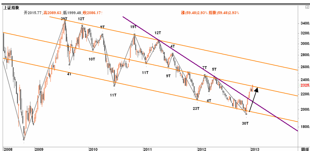
图2-1: 上证周K线图：2300一线的下行通道中轨到达，压力较大