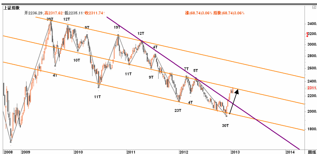
图2-1: 上证周K线图：2300一线的下行通道中轨到达，面临方向选择