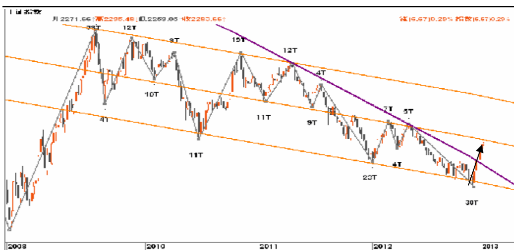
图2-1: 上证周K线图：2300一线的下行通道中轨即将到达