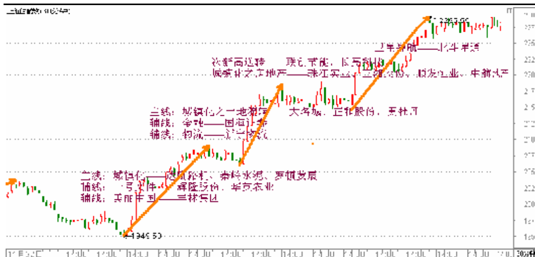
图2-2: 上证60分钟K线图：小时级别上涨有所背离