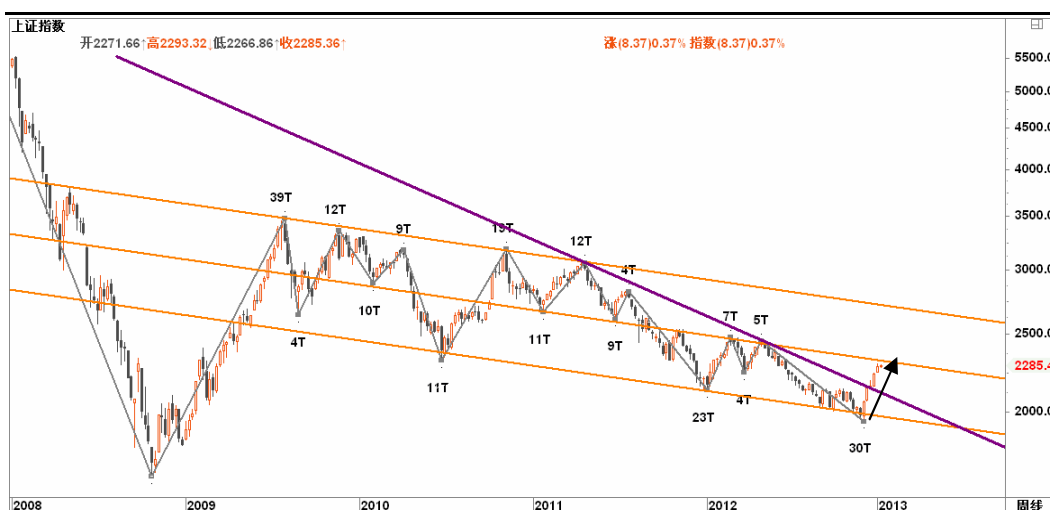
图2-1: 上证周K线图：2300一线的下行通道中轨即将到达