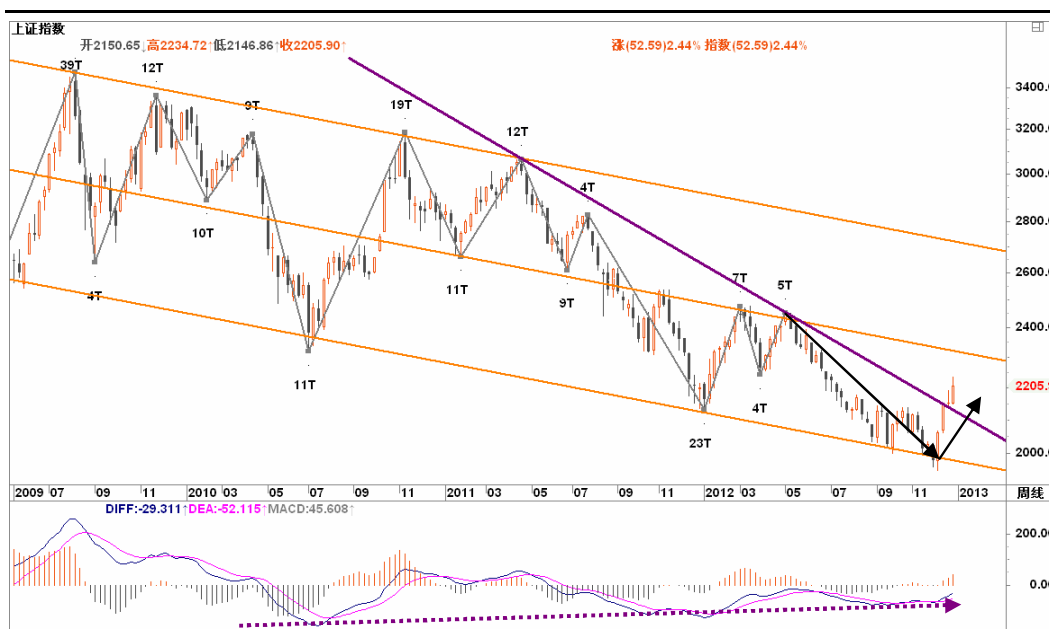
图2-1：上证周K线图：周线跨年上涨正在发酵