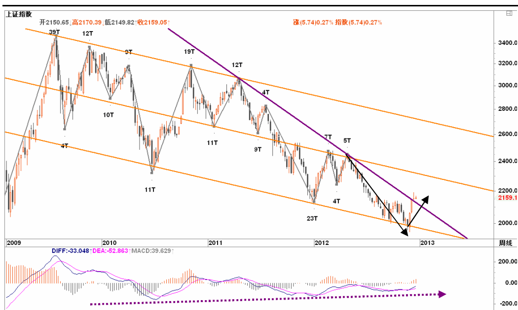
图2-1: 上证周K线图：遭遇下降趋势线，近期震荡将较为激烈