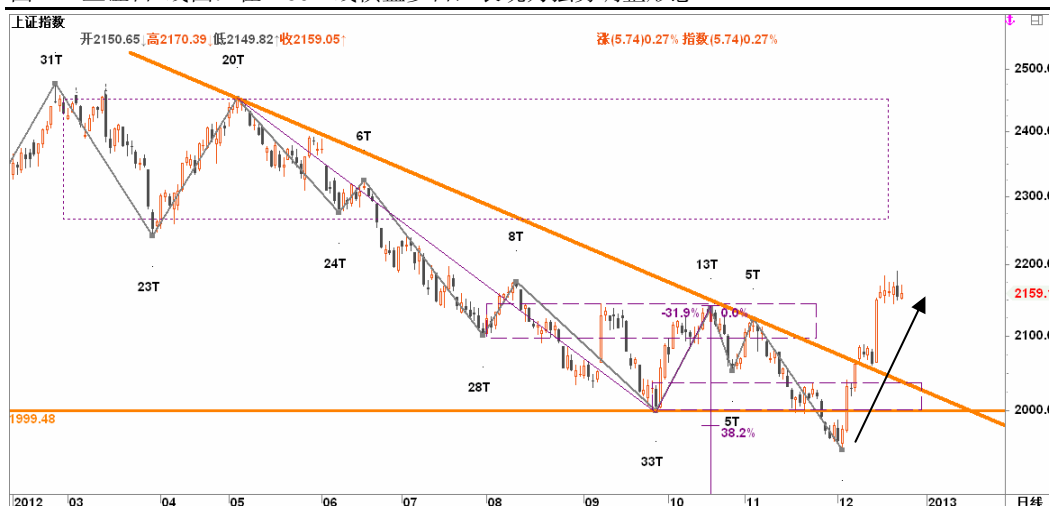
图2-2: 上证日线图：在2150一线横盘多日，表现为强势调整形态