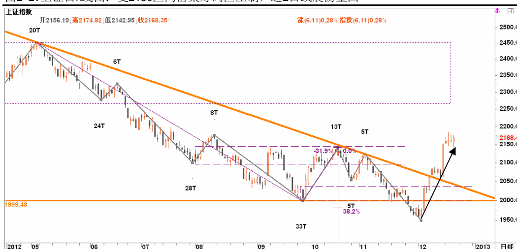
图2-2: 上证日线K线图：受2150区间密集筹码区压制，近2日或震荡整固