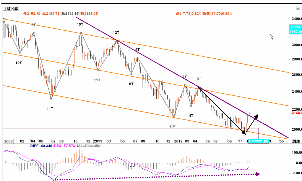
图2-1: 上证周K线图：遭遇下降趋势线，近期震荡将较为激烈