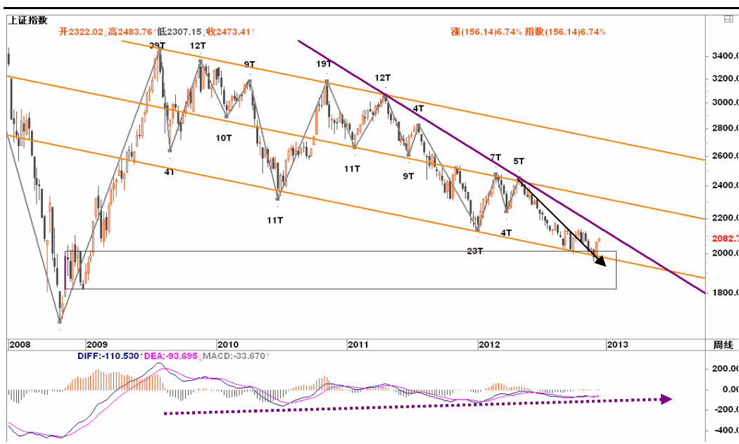
图2-1: 上证周K线图：周线级别年内有企稳迹象，年内冲击2100