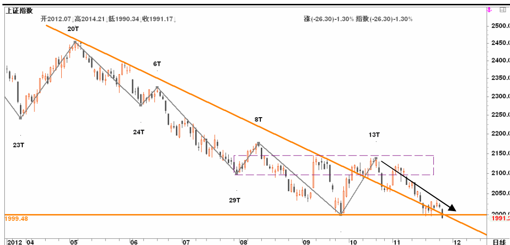
图2-2: 上证日K线图：2000关口与此前下跌趋势线的联合支撑被打破