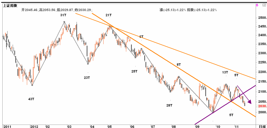
图2-2: 上证日线K线图：9月底开始的反弹上升趋势线已破位，月内或将再次考验2000关口