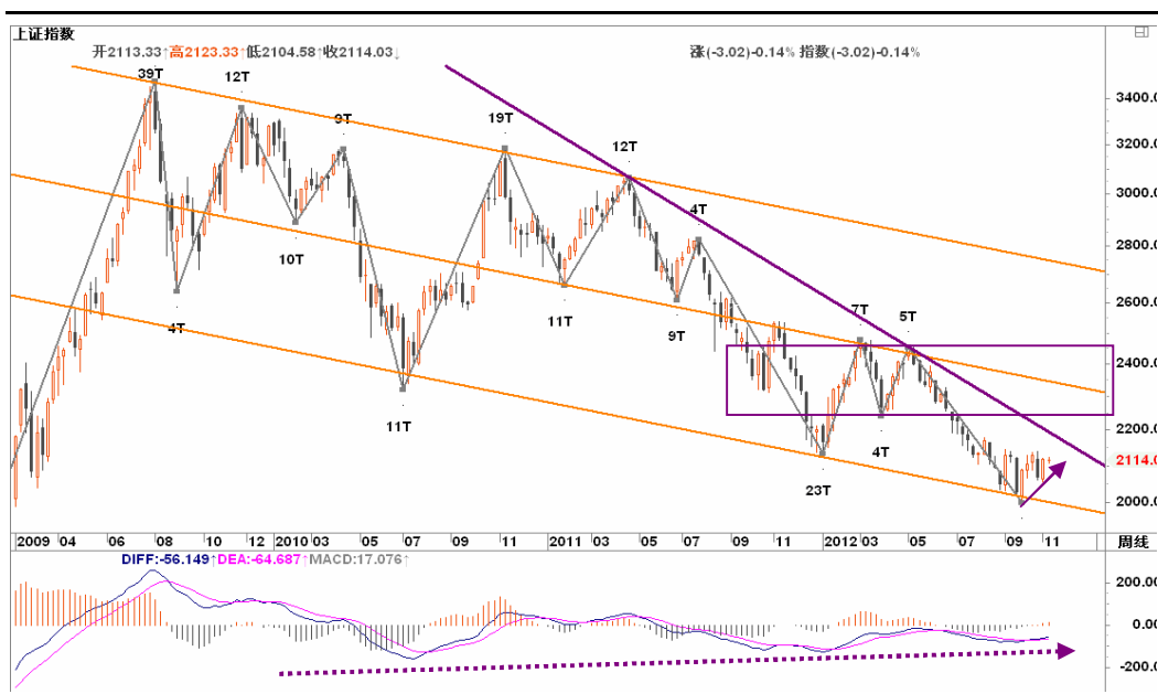
图2-1: 上证周K线图：周线级别反弹有望延续