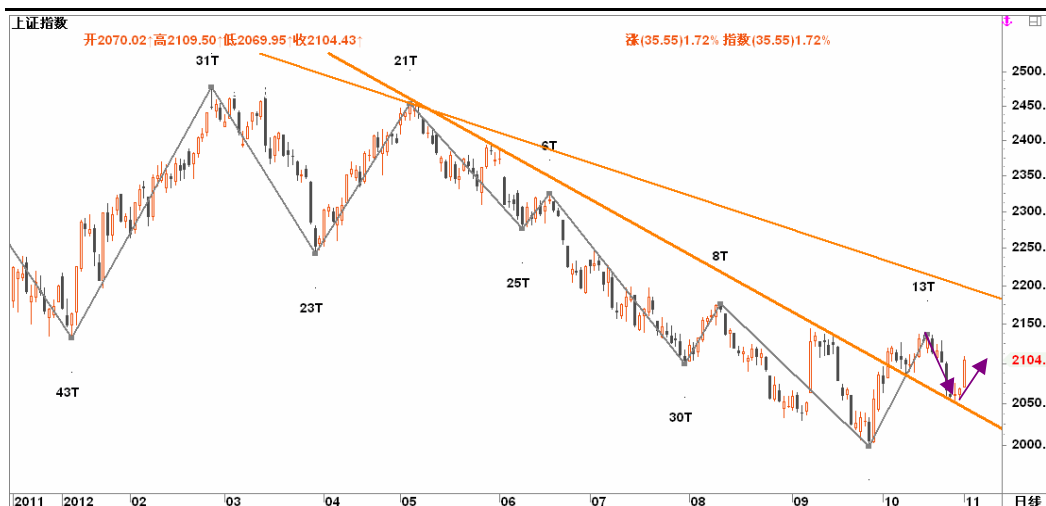
图2-2: 上证日线K线图：下行趋势线的支撑生效，有望继续上冲