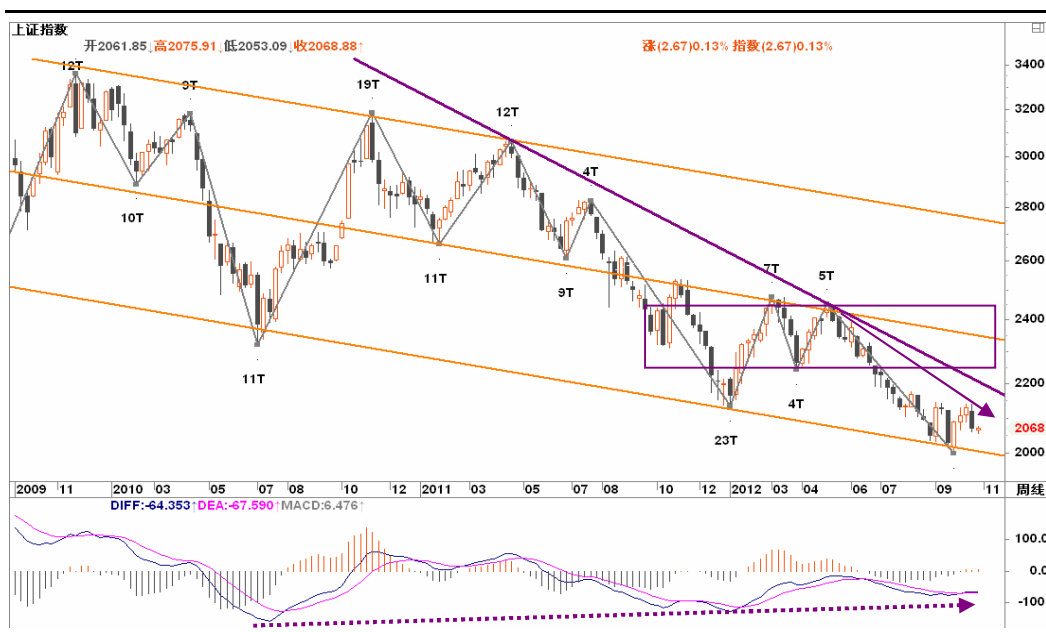
图2-1: 上证周K线图：周线级别反弹将面临较大考验