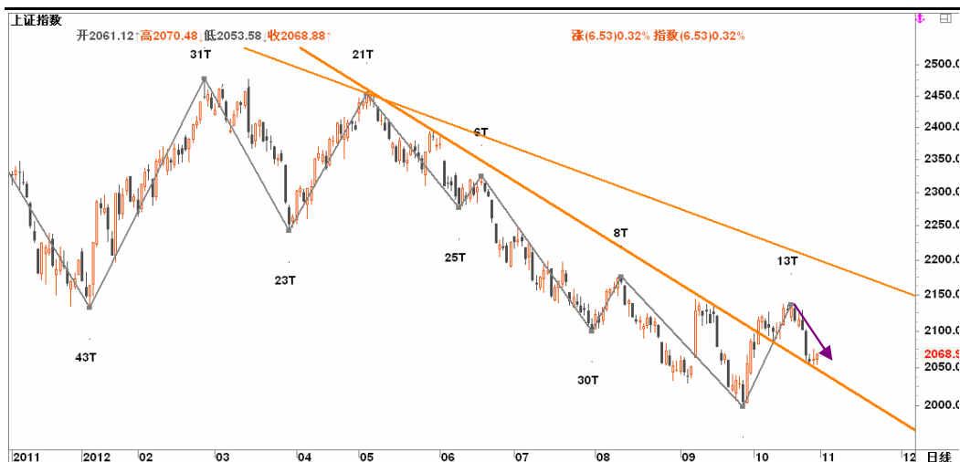
图2-2: 上证日K线图：关注下行趋势线的支撑效果，若下破，将进一步寻底