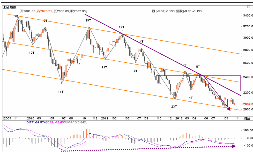
图2-1: 上证周K线图：周线级别反弹将面临较大考验，随时中道崩阻