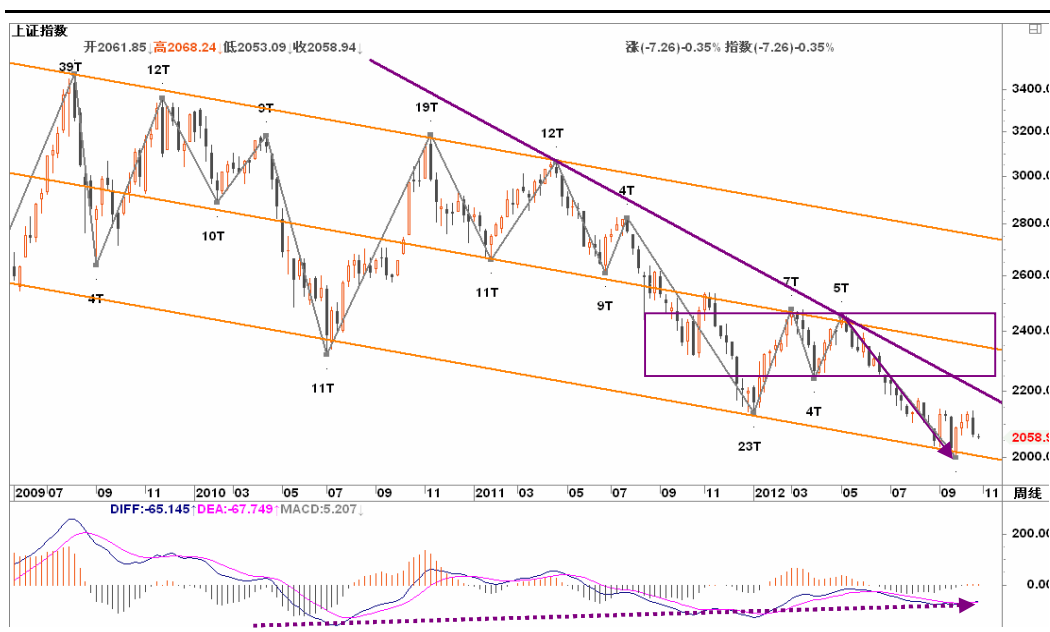
图2-1: 上证周K线图：周线级别反弹将面临较大考验，随时中道崩阻