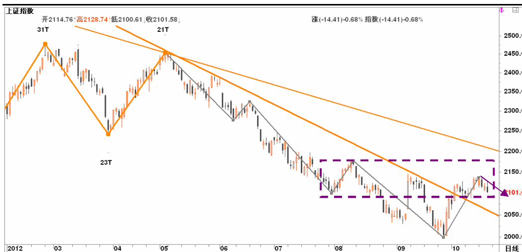
图2-2: 上证日线K线图：18大献礼行情的预热炒作力度衰减，已暂告一段落