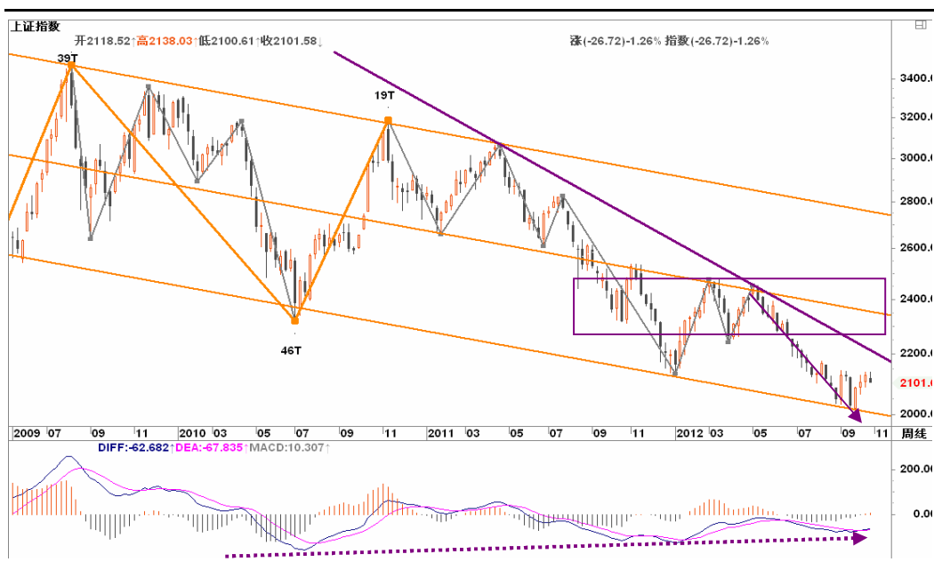
图2-1: 上证周K线图：本轮周线级别反弹将面临较大考验