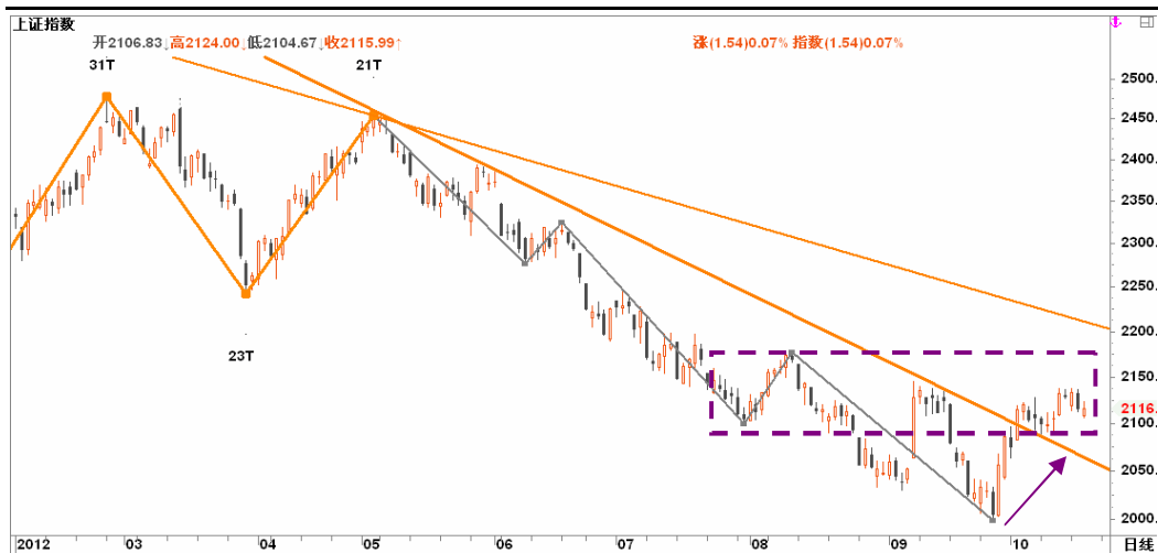
图2-2: 上证日线K线图：18大献礼行情的预热炒作力度衰减，近期或暂告一段落