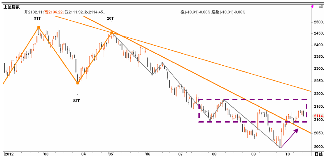
图2-2: 上证日线K线图：18大献礼行情的预热炒作力度衰减，近期或暂告一段落