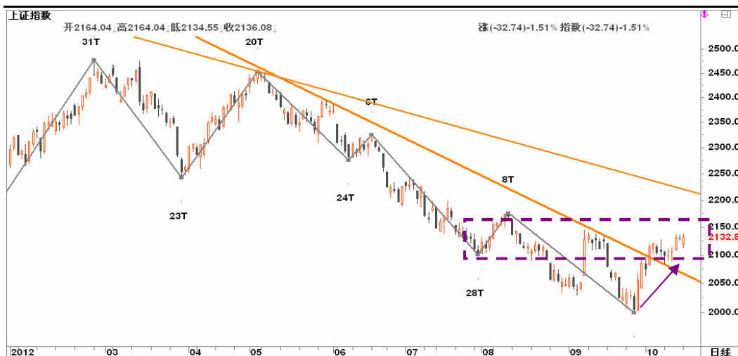
图2-2: 上证日线K线图：18大献礼行情的预热炒作力度衰减，近期可能会暂告一段落