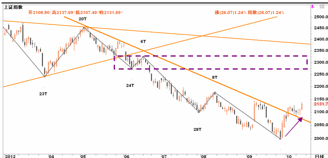
图2-2: 上证日线K线图：18大献礼行情顶住第一轮获利回吐考验，再度深化