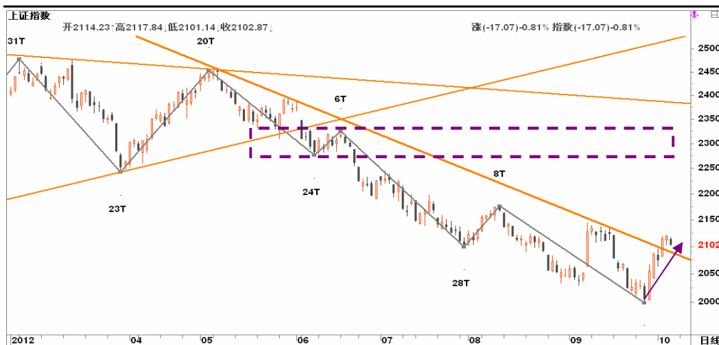
图2-2: 上证日线K线图：18大献礼行情展开1周后，将受第一轮获利回吐筹码的考验