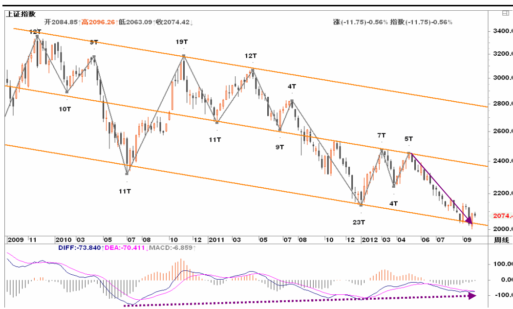
图2-1: 上证周K线图：在下跌通道下沿处暂获支撑