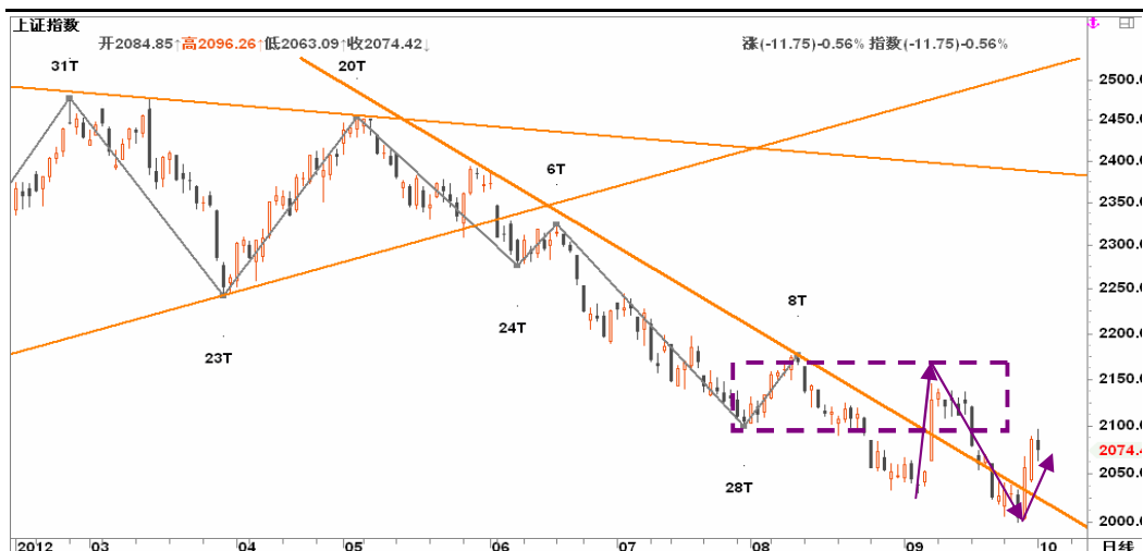
图2-2: 上证日线K线图：多头在2000关口发起反击后，18大献礼行情值得期待