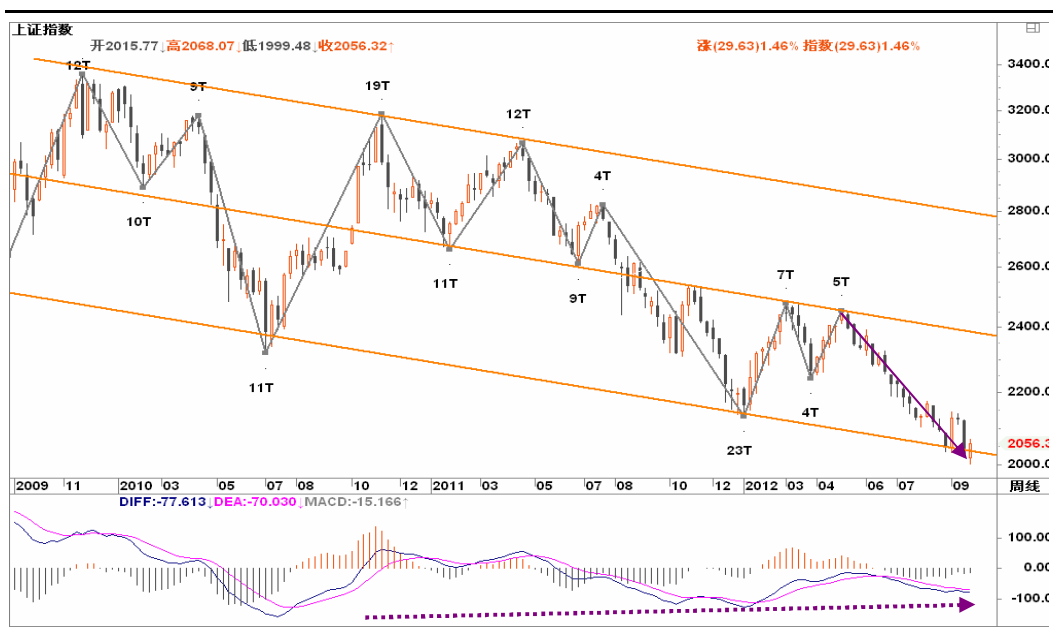
图2-1: 上证周K线图：多头反抗力度加强，或有助于本周周线收稳于2000之上