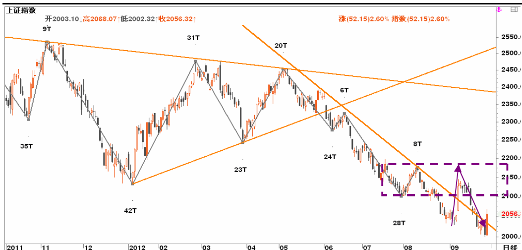
图2-2: 上证日K线图：多头借传闻在2000关口发起反击，不过量能不够，待节后放量后再寻多头生机