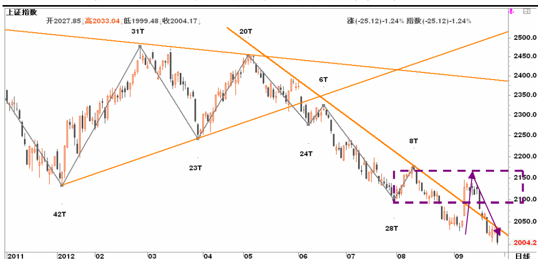
图2-2: 上证日线K线图：盘中下破2000关口，需等待企稳放量后再寻多头生机