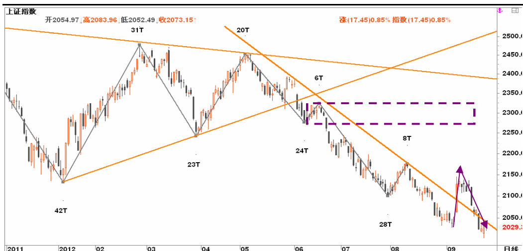
图2-2: 上证日线K线图：反抽草草终结，等待企稳放量后再寻多头生机