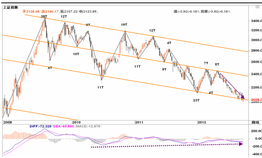
图2-1: 上证周K线图：在通道下沿2000左右考验支撑力度，如破2000，后期或奔1800