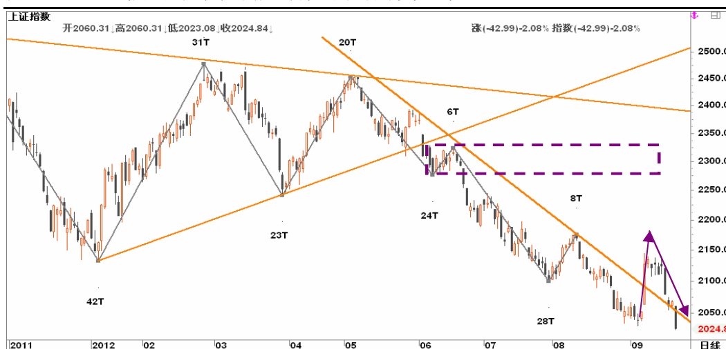
图2-2: 上证日线K线图：反抽草草终结，等待企稳后再寻多头生机