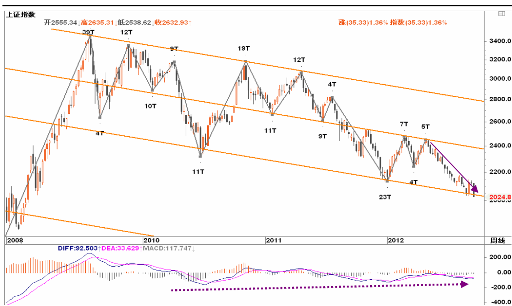
图2-1: 上证周K线图：在通道下沿2000左右考验支撑力度，如破2000，后期或奔1800