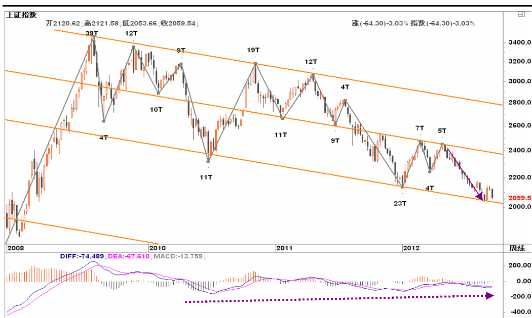
图2-1: 上证周K线图：在通道下沿2000获得支撑后，短期震荡剧烈，但仍有第二次回冲2400的可能