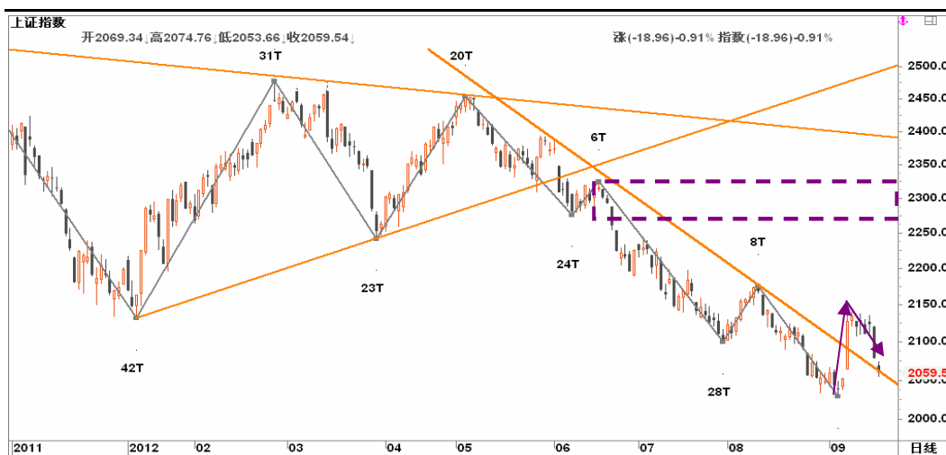
图2-2: 上证日K线图：反抽草草终结，等待企稳后再寻多头良机