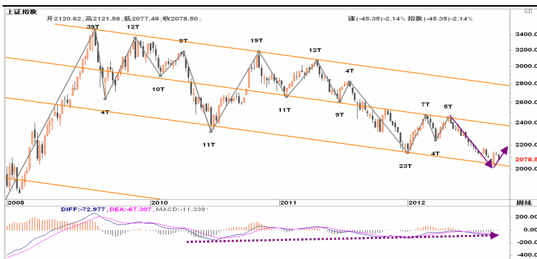
图2-1: 上证周K线图：在通道下沿2000获得支撑后，短期震荡剧烈，但仍有第二次回冲2400的可能