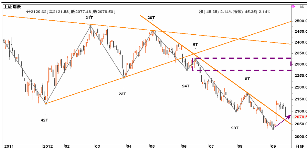
图2-2: 上证日K线图：反抽草草终结，等待企稳后再寻多头良机