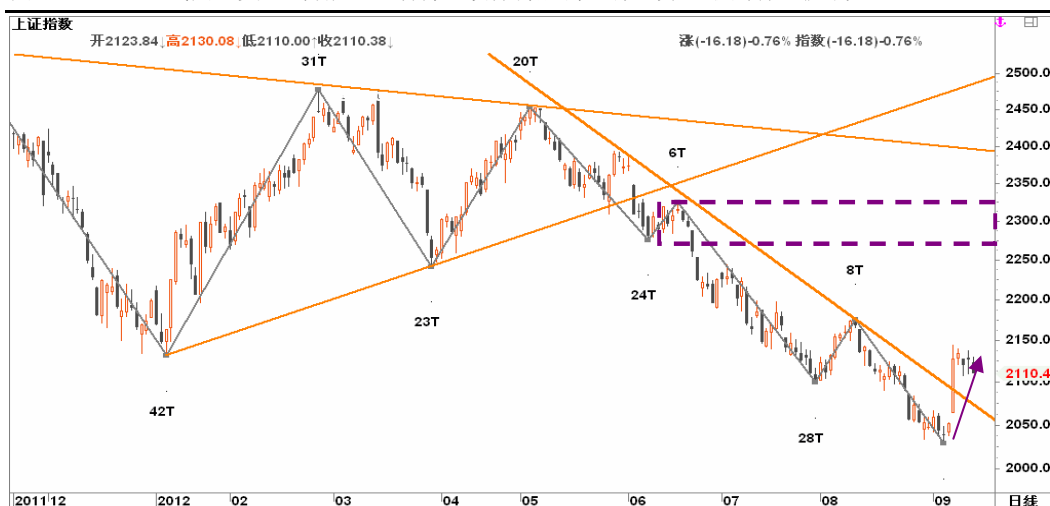
图2-2: 上证日线K线图：受QE3刺激，近期将继续保持震荡上行态势，最高有望挑战2400