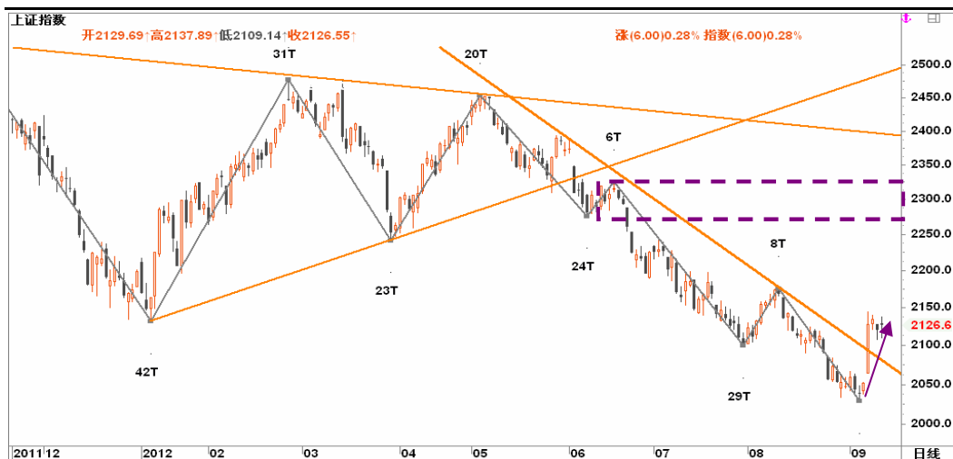
图2-2: 上证日线K线图：近期或走出震荡上行路线，阻力位在2300一线，最高有望挑战2400