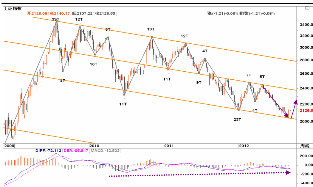
图2-1: 上证周K线图：在通道下沿2000获得支撑后，上证有望回冲2400