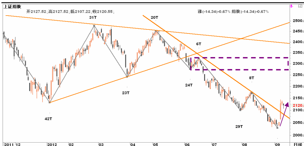
图2-2: 上证日线K线图：近期或走出震荡上行路线，阻力位在2300一线，最高有望挑战2400