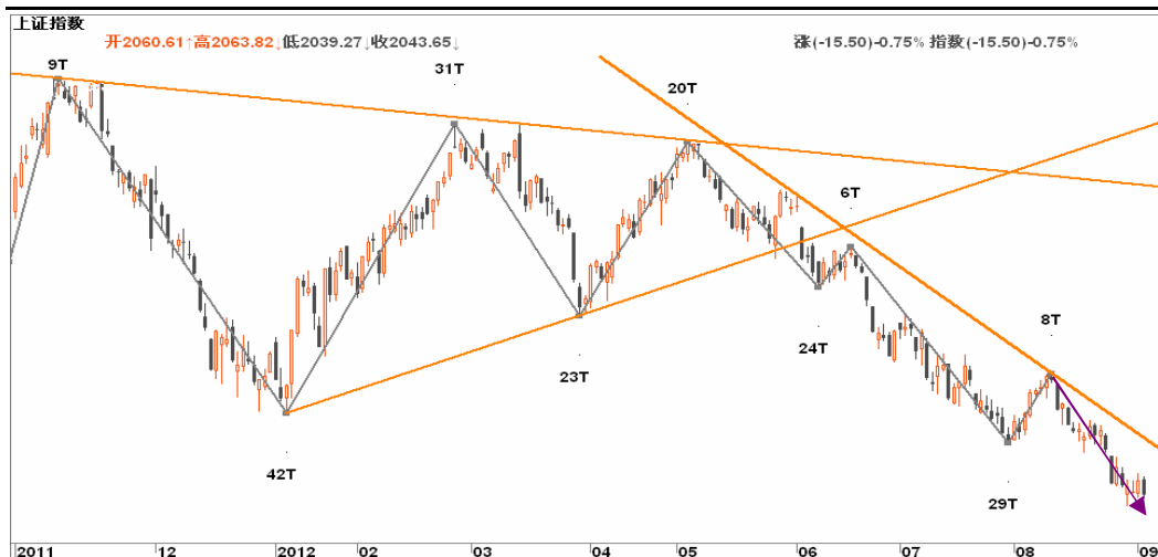
图2-2: 上证日线K线图：关注日线与周线背离的共振