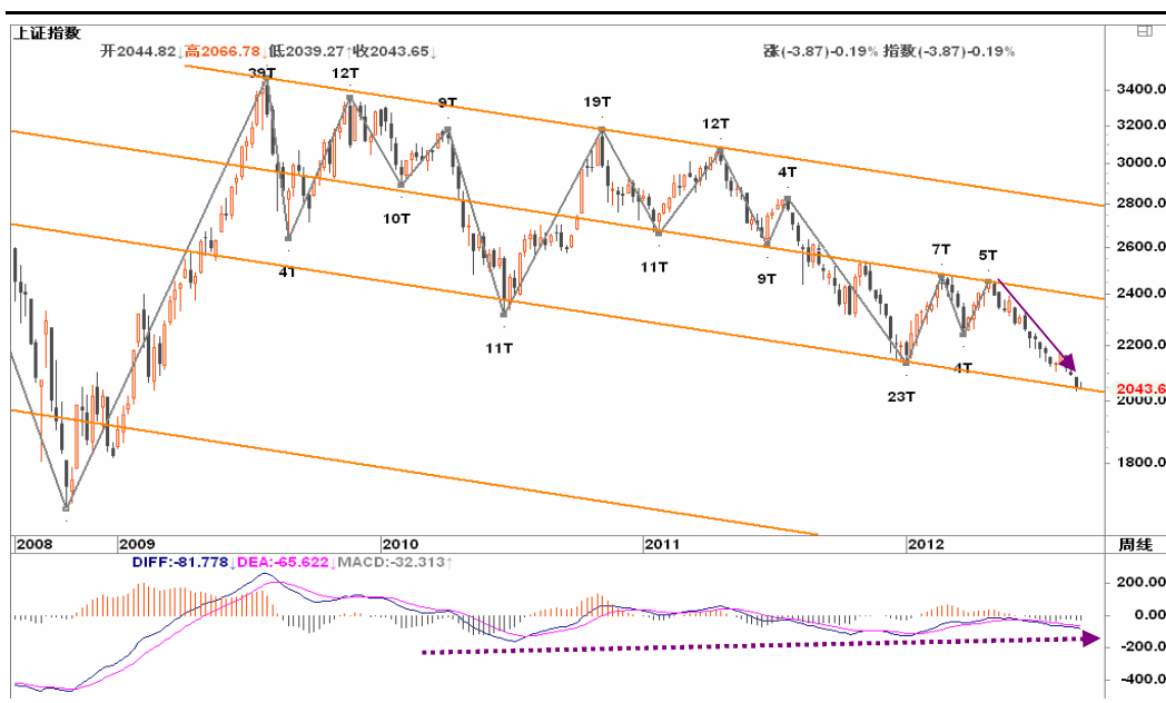
图2-1: 上证周K线图：下跌趋势延续，2050一带有所支撑，可关注位置与趋势背离的共振