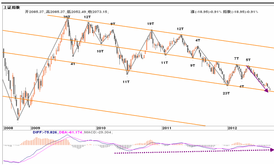
图2-1: 上证周K线图：下跌趋势延续，2050一带有所支撑，可关注位置与趋势背离的共振