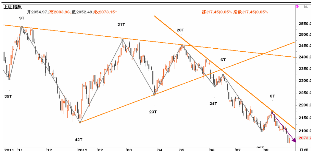
图2-2: 上证日线K线图：关注日线与周线背离的共振