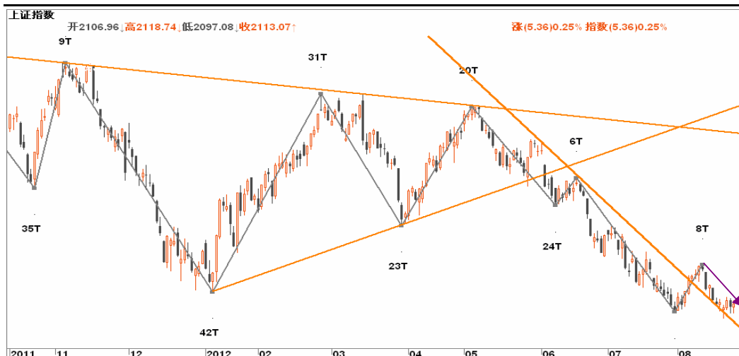
图2-2: 上证日K线图：关注日线与周线背离的共振