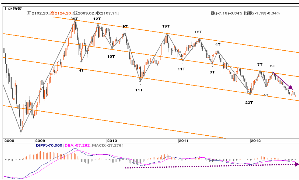
图2-1: 上证周K线图：下跌趋势延续，2050一带有所支撑，可关注位置与趋势背离的共振