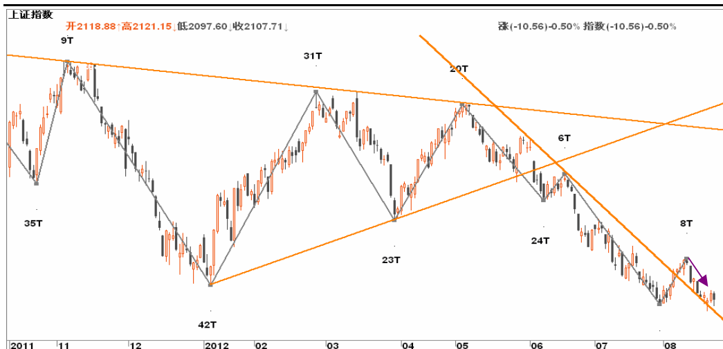
图2-2: 上证日线K线图：关注日线与周线背离的共振