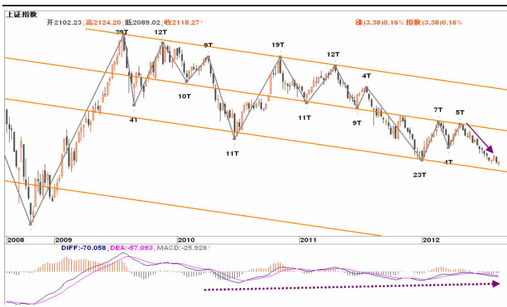
图2-1: 上证周K线图：下跌趋势延续，2050一带有所支撑，可关注位置与趋势背离的共振