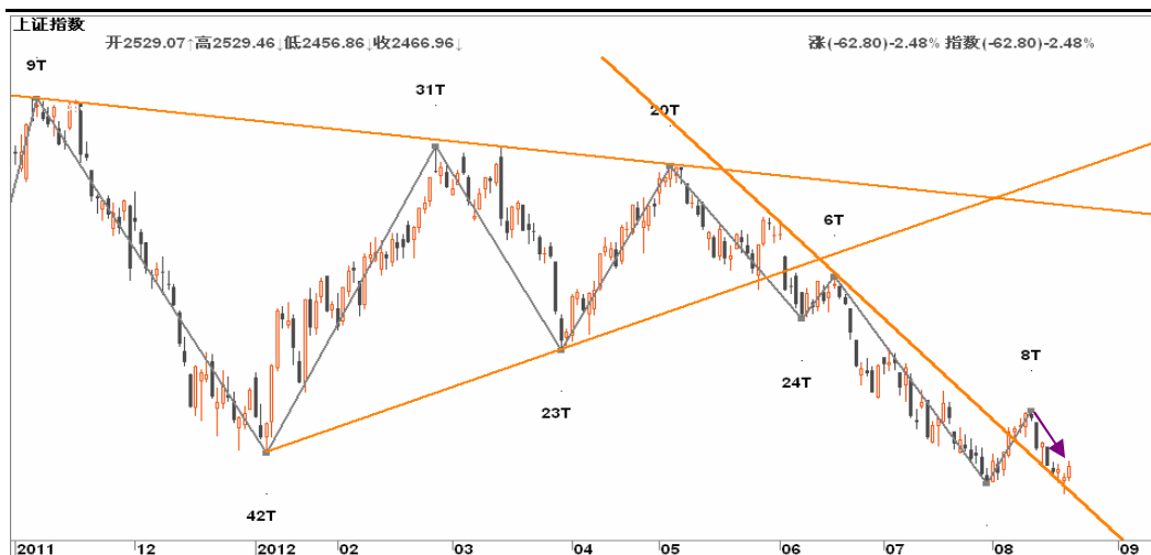
图2-2: 上证日线K线图：关注日线与周线背离的共振