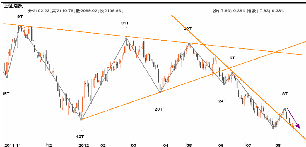
图2-2: 上证日K线图：反弹如黄粱一梦，短暂结束，接下来关注日线与周线背离的共振