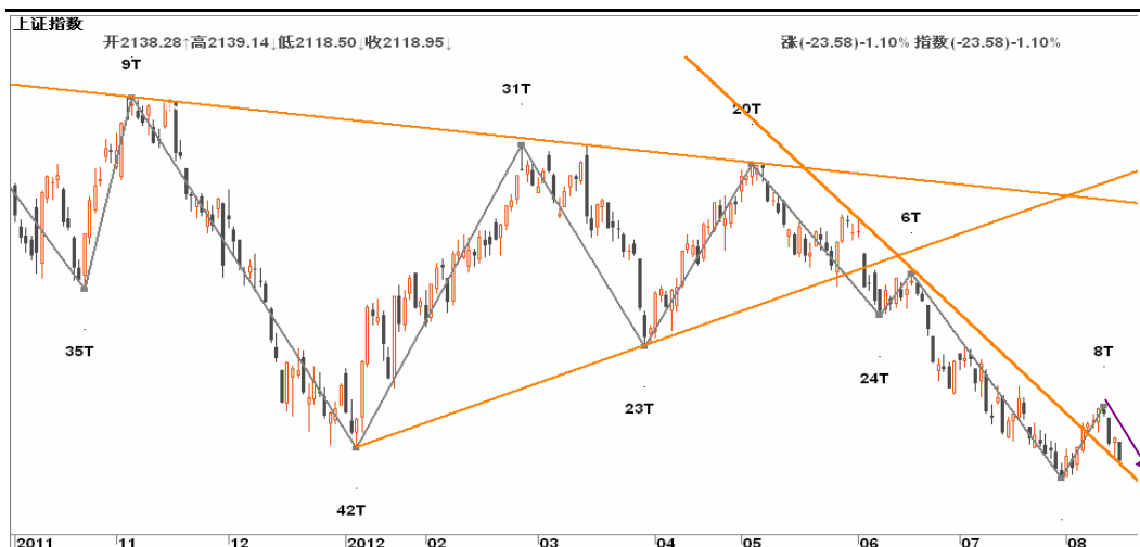
图2-2: 上证日线K线图：反弹如黄粱一梦，短暂结束，未来关注缺口长阴的位置