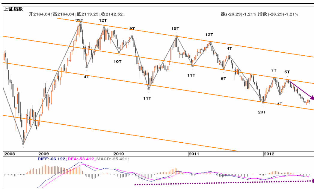
图2-1: 上证周K线图：下跌趋势延续，2050一带有所支撑，可关注位置与趋势背离的共振