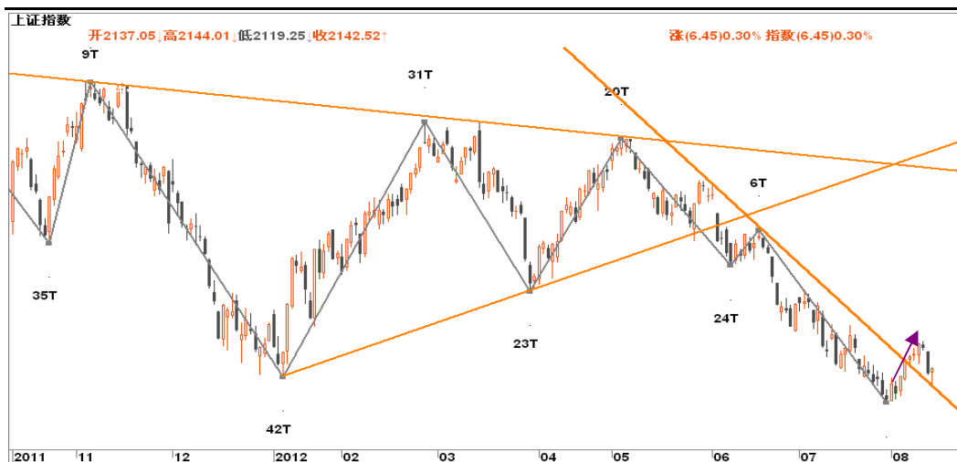
图2-2: 上证日线K线图：关注缺口长阴的位置