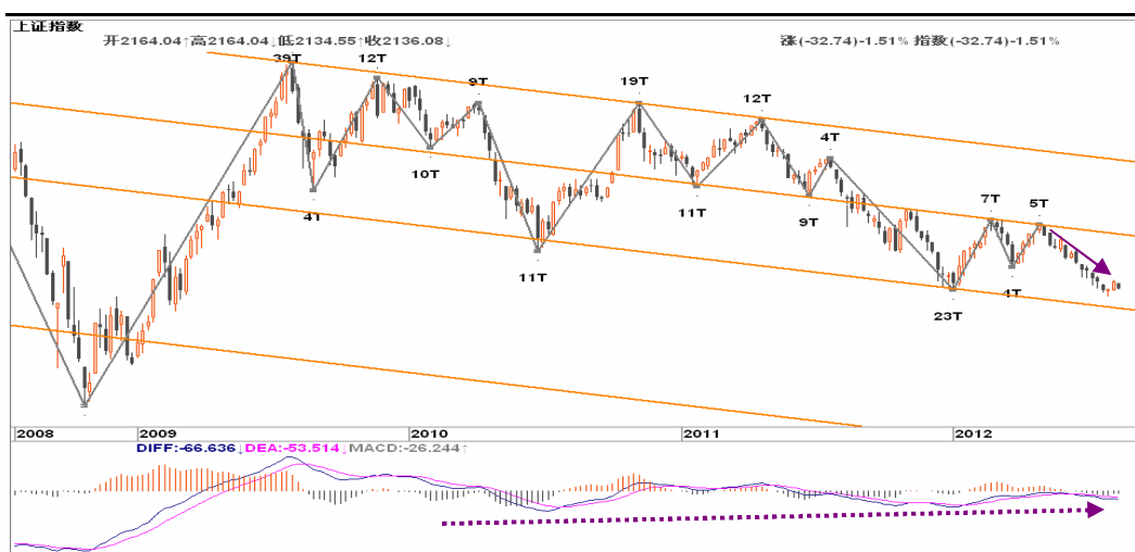
图2-1: 上证周K线图：下跌趋势延续，2050一带有所支撑，可关注位置与趋势背离的共振