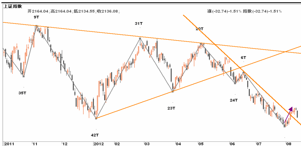
图2-2: 上证日K线图：昨日留下缺口长阴，反弹已有结束迹象