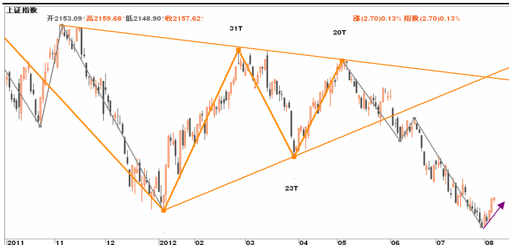
图2-2: 上证日线K线图：空头继续等待逢高沽空机会，暂不建议多头抄反弹