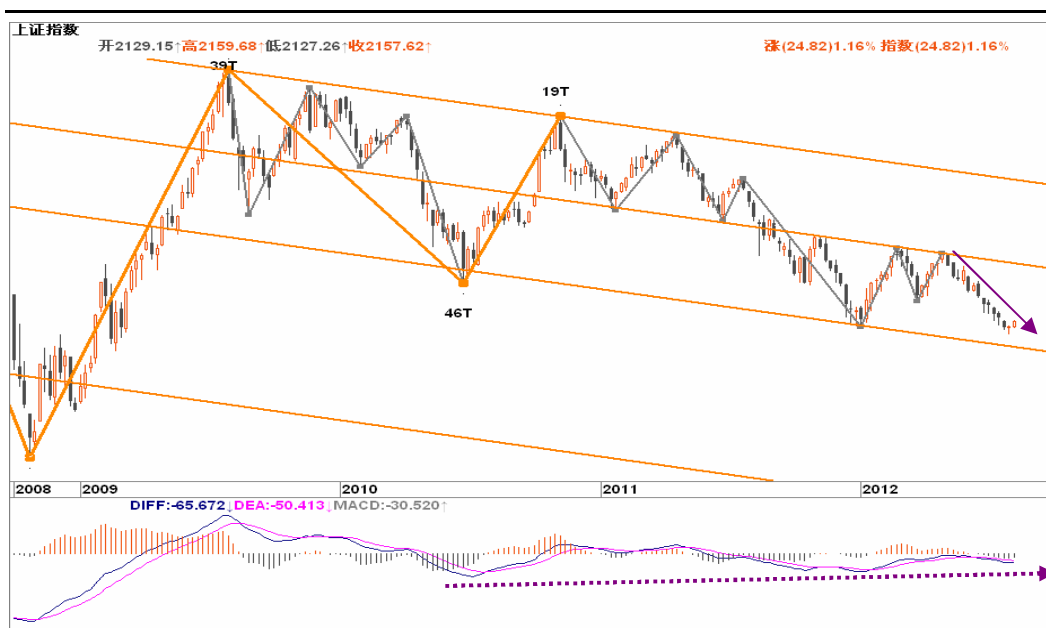
图2-1: 上证周K线图：下跌趋势延续，2050一带有所支撑，可关注位置与趋势背离的共振